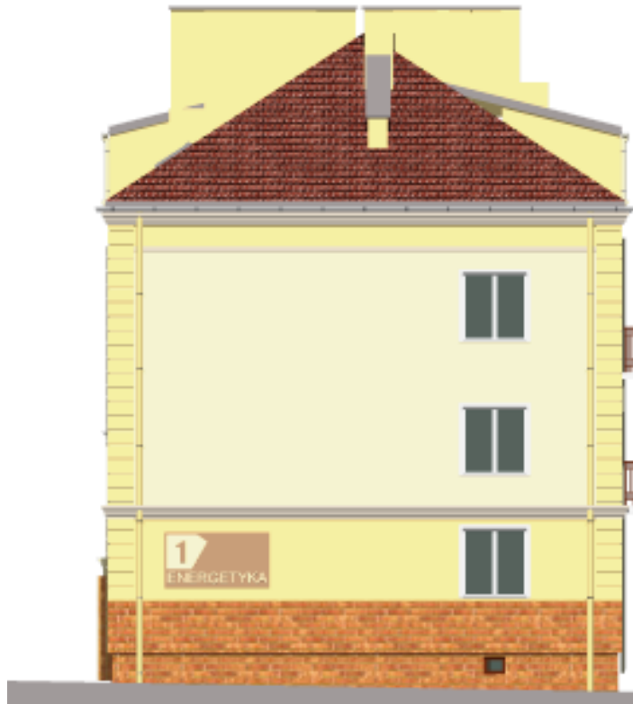
Widok budynku od strony południowej